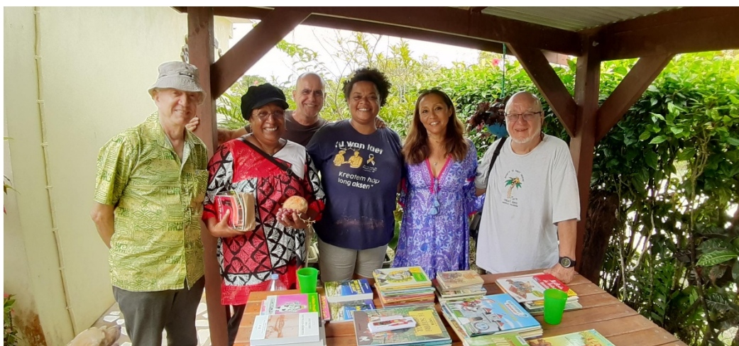
Le second don de livres auprès du Consul (en arrière-plan)

Puis ce fut le départ pour Port-Olry, le dernier centre situé au bout de la grande île de 3900 km 2 à 62 km de Luganville. Ce village francophone de 2000 habitants, du nom du navigateur français qui fut gouverneur de la Nouvelle-Calédonie en 1878, fut créé en 1899 par des missionnaires catholiques. Un véhicule-taxi de grande dimension avait été loué grâce au consul. Le trajet durera, dans des paysages magnifiques, plus d'une heure et demie en raison de la détérioration de la route pourtant réalisée il y a seulement quelques années par les Japonais mais probablement pas adaptée aux tropiques. Avant d'arriver à Port-Olry, nous nous arrêtons pour nous restaurer " Chez Louis", mini gîte touristique famille de notre chauffeur, situé au bord d'une plage paradisiaque où nous dégustons un délicieux crabe de cocotier. Ce fut ensuite le départ pour notre troisième don d'ouvrages qui au final fut, sans le faire exprès, le plus important ce qui n'aura pas été inutile vu la précarité de la population et de l'école.