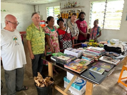
L'Alliance Champlain avec la Direction de l'école