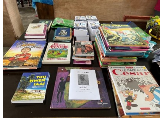
La remise des livres

coutumier fut empreint de beaucoup d'émotion également. C'est alors que nous nous rendons compte des conséquences positives dans cet endroit des plus reculés de l'archipel de la visite du Président de la République à Port-Vila deux semaines auparavant. La présence de la France est un réconfort pour les populations francophones peu aidées depuis l'indépendance de juillet 1980. Des vêtements et des peluches pour bébés et nourrissons furent également offerts.